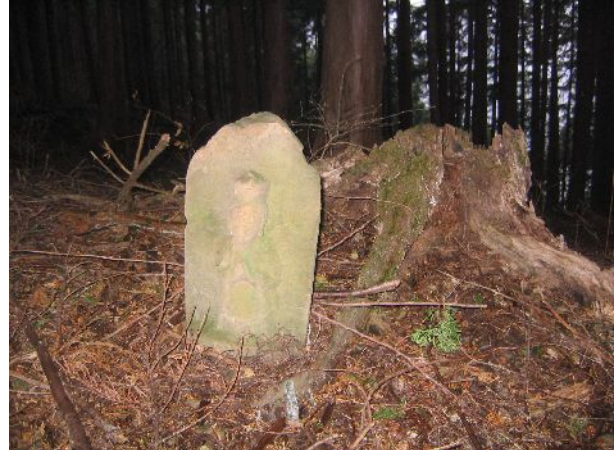
久保田古道三十三観音