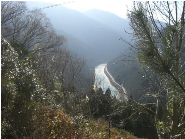
大滝から天竜川を見下ろす

バスにて佐久間町西渡へ。大滝集落までの古道ハイキング。歩行時間は6時間程度。歩行標高差は約200m。地図上の水平距離は約3km。古道の道標や久根鉾山用の火薬庫跡、集落跡、砦跡や芝地藏、行者様、鳴瀬沢の滝音と景観、天竜川を見下ろす雄大な眺望。「塩の道」の一部で、ほとんど山道。