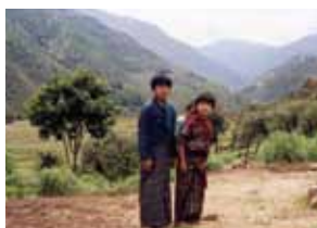
ブータンの子どもたち