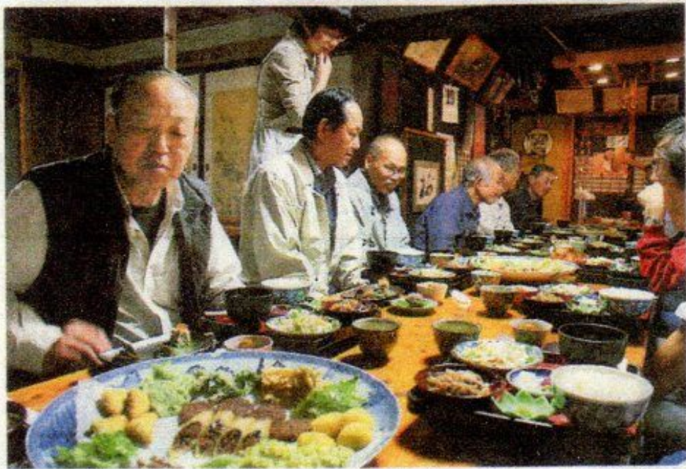
雑穀料理に舌鼓を打ち、水窪地域の食文化に理解を深める参加者＝浜松市天竜区水窪町の「つぶ食石本」